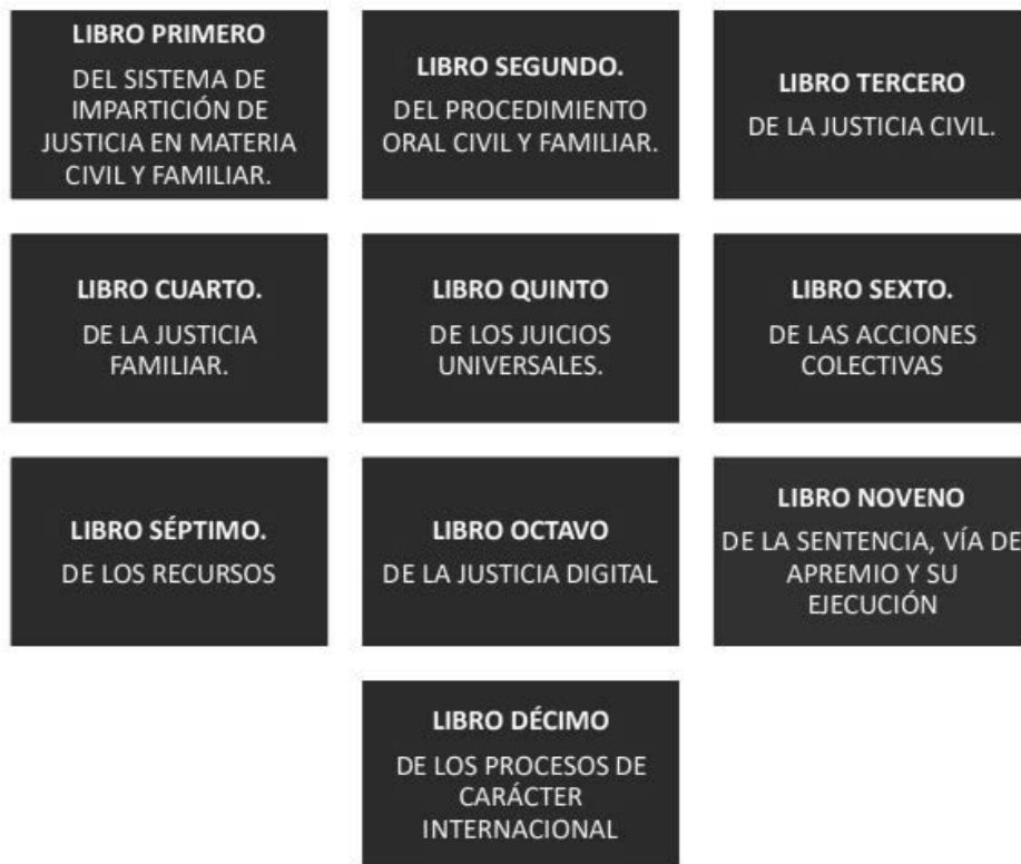
Figura 1 Libros que integran el CNPCF

Los primeros dos libros de este código refieren disposiciones comunes para los procedimientos civiles y familiares, incluyendo cuestiones generales como las formalidades del procedimiento, reglas para la fijación de competencia, impedimentos, excusas y recusación para funcionarios judiciales, reglas para las actuaciones y resoluciones judiciales, medios de premio y correcciones disciplinarias, notificaciones, disposiciones de la etapa postulatoria, probatoria y un denominado juicio oral sumario.