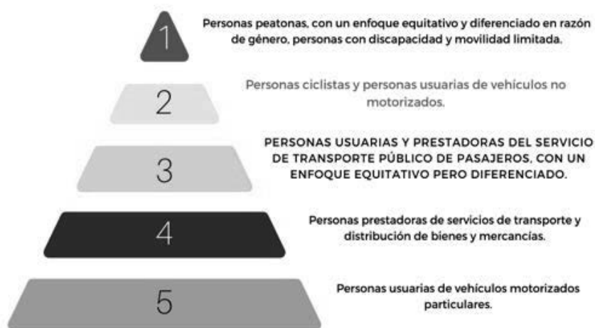
Figura 1. Jerarquía normativa

Nota: Elaboración propia con datos de la Ley General de Movilidad y Seguridad Vial.